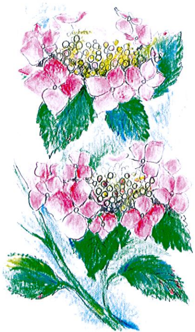
額紫陽花 (がくあじさい)

毎日の生活に欠かせないお水…岩深水は、いかがでしょうか。「のし」や「メッセージカード」はもちろん、初めて岩深水を飲んでいただく方には、「岩深水のお召し上がり方について」を貼付させていただいております。暑い夏場は特に水分補給として、そうめんなどのお料理にもと先様の健康と安全を気遣った品として喜んでいただけるものと思っております。お中元用申し込書付パンフレットも添付いたしましたので是非ご考慮下さいませ。ご注文をお待ちしております。